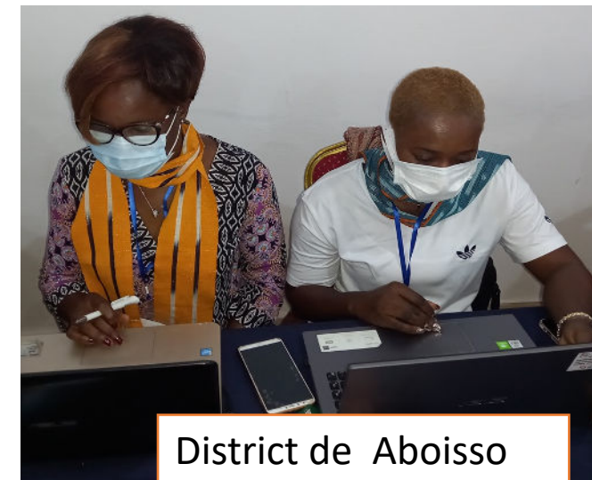
District de Aboisso