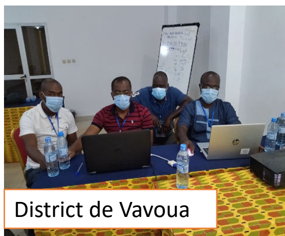
District de Vavoua