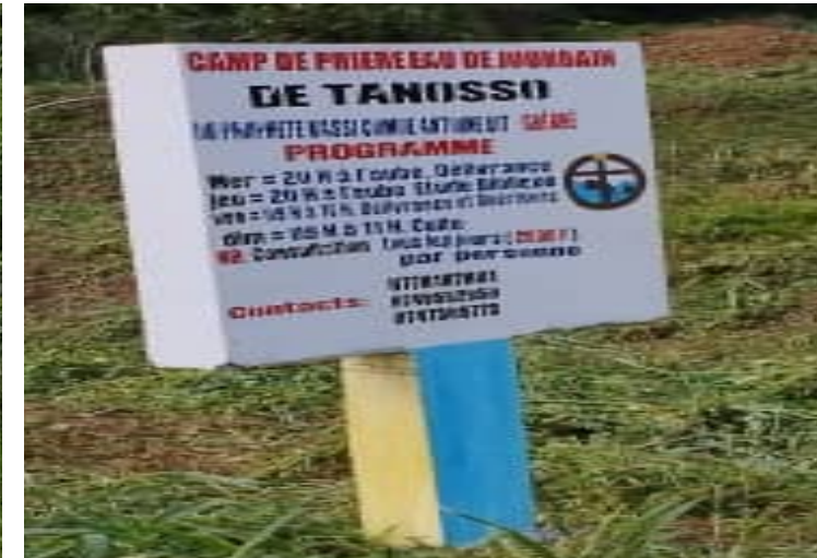
Pancartes indiquant des camps de prière